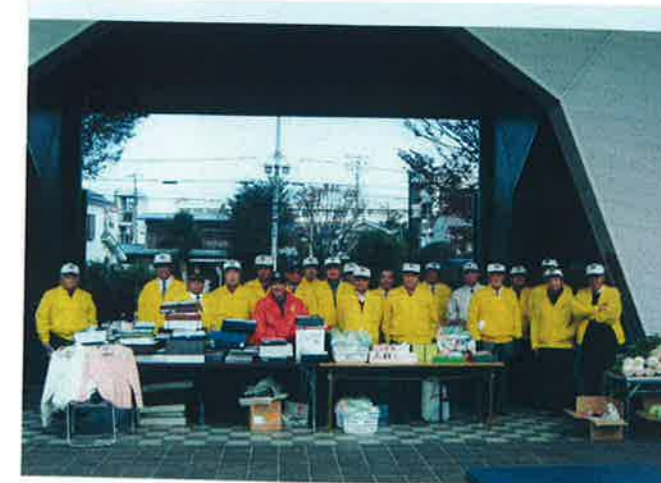
朝陽学園チャリティーバザー